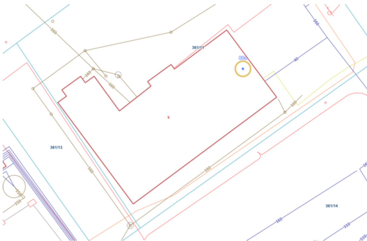
Rysunek 1 Układ obiektów i przyłączy na działce

Układ obiektu oraz przebieg przyłączy na terenie inwestycji zaprezentowano na rysunku poniżej (rys. 1).